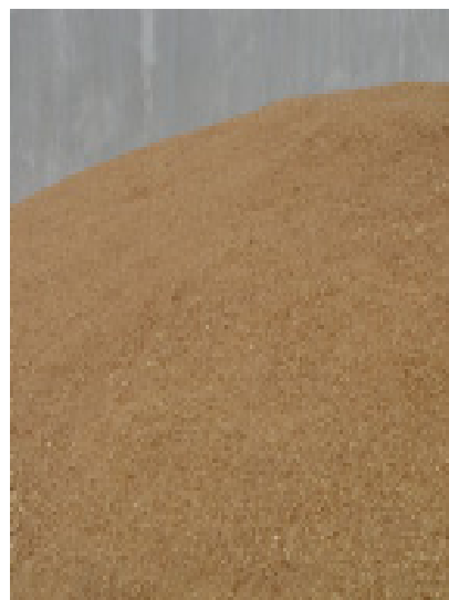
Diversos residuos de las fábricas de puertas constituyen la biomasa necesaria para la central.

El importe de la inversión asciende a más de once millones de euros