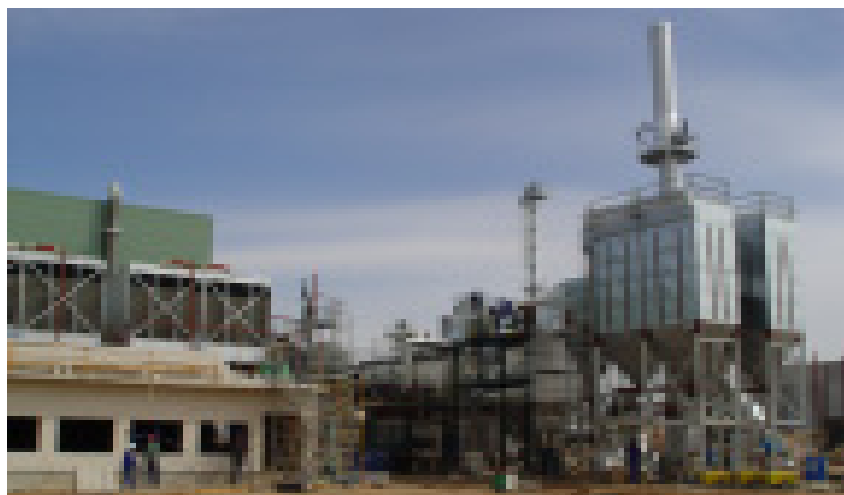
Vista de la central térmica de Villacañas, a principios de marzo

con el objeto de construir y operar una planta de generación termoeléctrica a partir de los residuos de madera procedentes de la fabricación de puertas, molduras, etc.. El proyecto logra la financiación de Banco Urquijo, Caixa Nova, Bancaja y Caja Castilla-La Mancha, a lo que hay que sumar la aportación de los propios socios (un 30% aproximadamente).