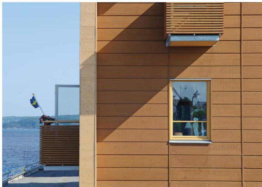
gráfico con los estrechos balcones que se destacan de la fachada. El tejado es de gran pendiente y se cubre con plancha de acero ranuradas.

Dos tipos de apartamentos Los apartamentos se han organizado teniendo en cuenta a la vez las posibilidades que ofrece una construcción en madera maciza. El piso estándar tiene 69 m 2 , con tres dormitorios y el pequeño es de 44 m 2 sólo con dos dormitorios. La cocina y el baño se ubican en el interior de la planta. El salón es la habitación más grande y se prolonga en un balcón.