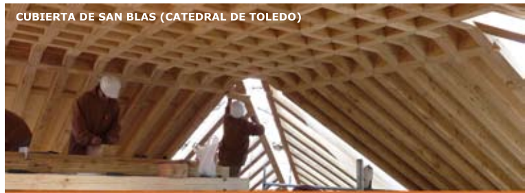
CUBIERTA DE SAN BLAS (CATEDRAL DE TOLEDO)

www.archtp.info 50 años de experiencia en España.