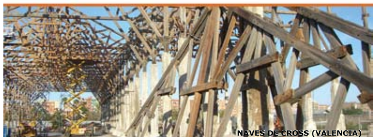
NAVES DE CROSS (VALENCIA)

C/ Beethoven, 9, Ent. (08021) BARCELONA 93 400 47 00