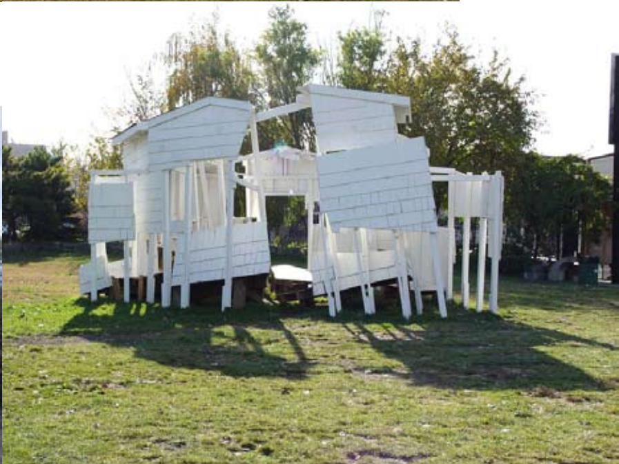
When I Woke Up 1995-1996 h: 365.76 x w: 365.76 x d: 426.72 cm