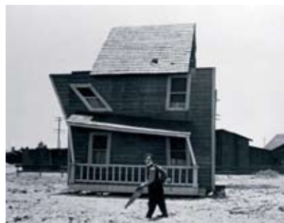
Fotograma de One week, de Buster Keaton

Traslado a Nueva York. Estudios de arquitectura en la Cooper Union. Universidad de Columbia: programa de educación continua.