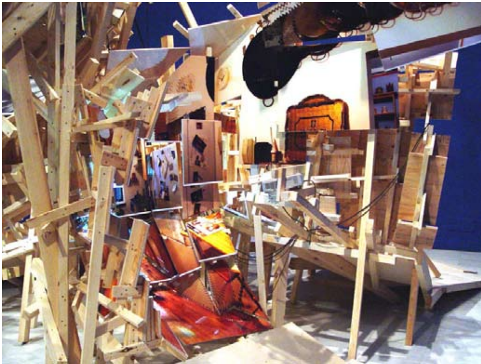
Thinking About That Place 2004 Museo Nacional Centro de Arte Reina Sofia. Madrid