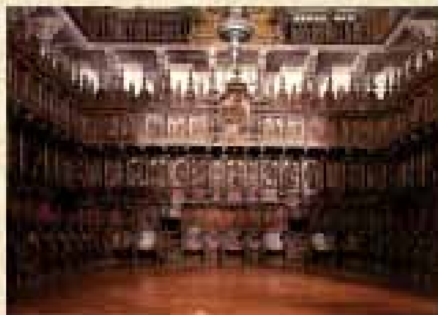
Interior del coro de la iglesia de San Martín de Pineda (Heritage de Compostela)

Restauración especializada de la madera mediante el sistema BETA, a base de resinas epoxídicas especiales y varilla de fibra de vidrio protensada