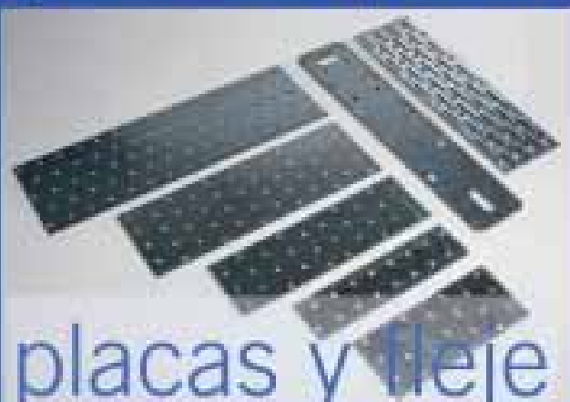
placas y fleje