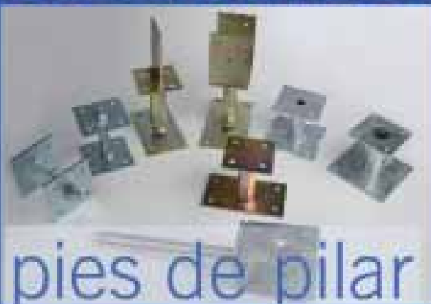
pies de pilar