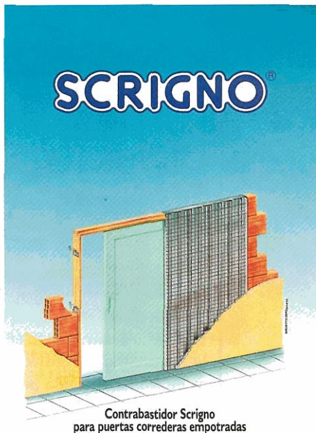
Contrabastidor Scrigno para puertas correderas empotradas

Esta prueba ha simulado el uso cotidiano de un grupo contrabastidor/guía portante/guía corredera/puerta durante más de veinte años ; en efecto, la prueba se ha prolongado durante 100.000 ciclos con una carga aplicada al par de guías correderas igual al máximo aconsejado por la empresa productora y con un desplazamiento igual a la apertura media de una puerta standard. Durante toda la prueba, a periodos de tiempo