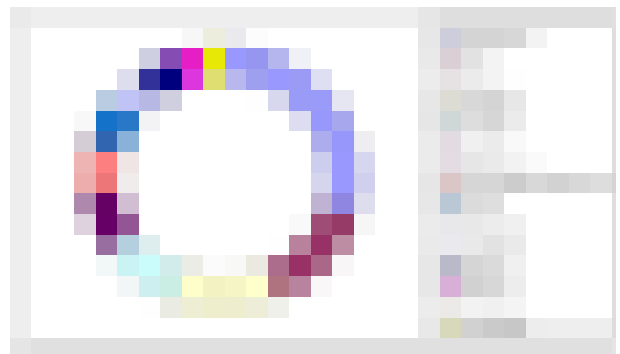
Consumo por países