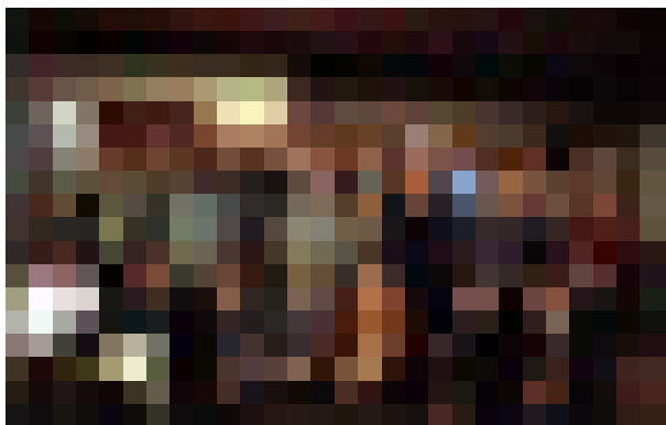
Asistentes al curso de Tecnología de la Madera en el INIA