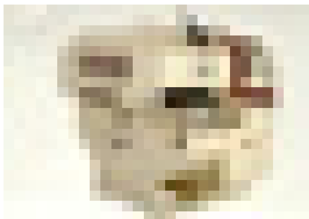
Sierra múltiple KM 310 con sistema Hidrofix

Interholz Raimann, de Friburgo (Alemania), estuvo presente en Madertec a través de su representante Maesma presentando una sierra múltiple con desplazamiento de un disco móvil de la serie KM para el corte de madera maciza. Las hojas de sierra se fijan sin casquillo porta-hojas adicional ni anillos espaciadores, directamente sobre el eje de la sierra. Si los anchos de corte varían con frecuencia se requiere el cambio de paquetes de discos por lo que este sistema supone un ahorro importante de tiempo de preparación de la máquina.