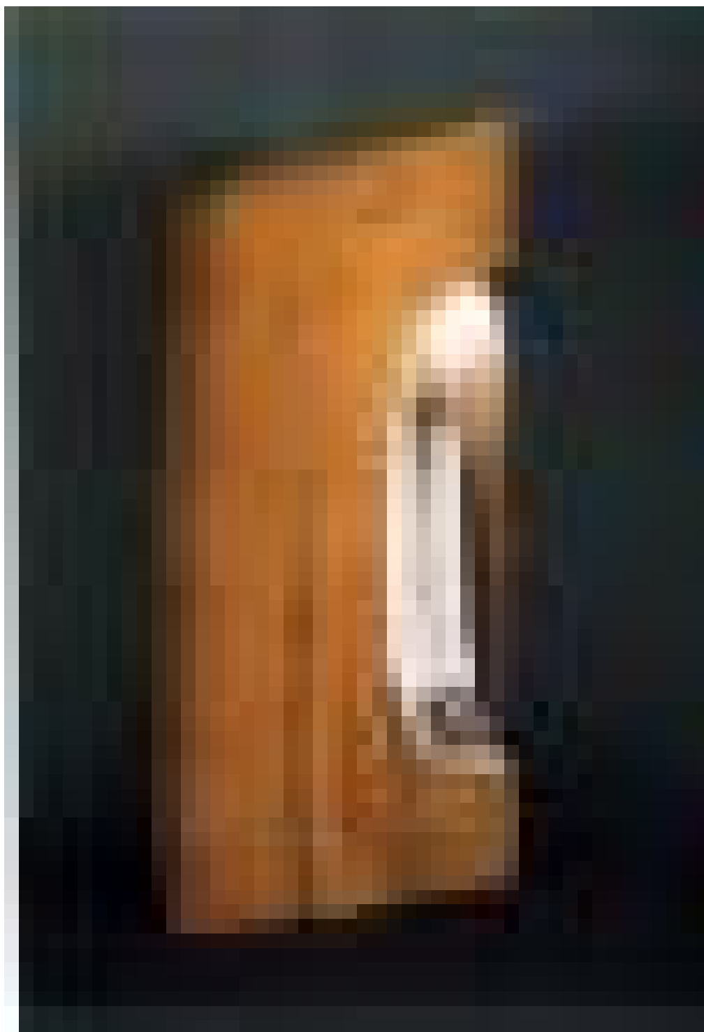
FLOR DE LA MADERA. 1999 TALLA DE MADERA DE CEREZO Y PIGMENTOS. DIMENSIONES: 40 X 17 13 CM

Hasta ahora ha utilizado sabina, olmo y Pino laricio