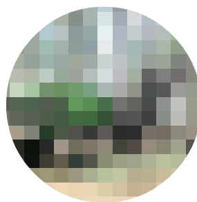
PROCESADORA SOBRE DINGO

Esta 3ª edición supone la consolidación del certamen, imprimiéndole mayor estabilidad ante los avatares y vaivenes de instancias ajenas al sector, inevitables en todo comienzo.