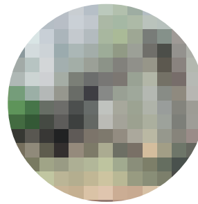
DINGO CON CABEZAL PROCESADOR EN GRÚA PARALELA

demostraciones de su maquinaria. Así fue posible observar la evolución de desbrozadoras, trituradoras, autocargadores, cabrestantes, grúas, tractores forestales, procesadoras, y múltiples herramientas e implementos forestales. Los cabezales procesadores tuvieron una relevancia especial, presentándose sobre una diversidad de máquinas, desde tractores forestales, retroexcavadoras de cadenas, retroarañas, autocargadores transformados. Incluso estuvieron presentes autocargadores y procesadoras forestales de las mejores marcas europeas, en versiones de tamaño adaptado a la demanda nacional. Asimismo se celebró el Open Internacional de Motoserristas.