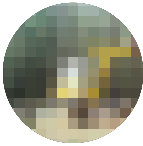
ACROBACIAS DE RETROARAÑA CON CABEZAL PROCESADOR

asturianos, se alterna con FOREXPO, en la Landas francesas, convirtiéndose gradualmente de esta forma, junto con esta última, en una referencia obligada de los empresarios forestales de la península.