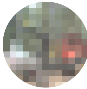
AUTOCARGADOR FORESTAL CARDELLE

En esta edición la organización no escatimó recursos humanos (más de 40 personas según los organizadores) para organización y apoyo logístico, dando especial énfasis a la seguridad (reflejo de la importancia que el sector asturiano está dando a este tema), y los servicios de autobuses desde el aparcamiento de vehículos de visitantes, que por limitaciones estructurales debía de estar a un par de kilómetros. Expusieron un total de 81 expositores, de los que 14 eran extranjeros. No se trata de un número elevado si además descontamos los stands de asociaciones y publicaciones, pero se va consolidando frente a los 72 expositores de 1999 y 51 de la primera edición. Más significativo es el número de visitantes