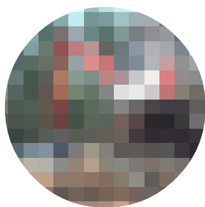
PROCESADORA DE CADENAS NEUSON

de las mejores máquinas no tienen nada que envidiar al sector del automóvil.