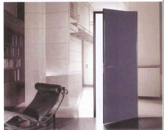
DOS ASPECTOS DE LA PUERTA LUALDI SUPER