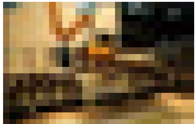
CENTRO DE MECANIZADO CNC Y CANTEADO DE PIEZAS CURVAS BAZ