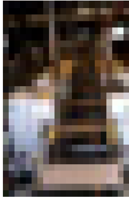
LÍNEA DE FORMATEADO Y CANTEADO HOMAG-BARGSTEDT

Se trata de una línea totalmente automatizada en la que se procesan las piezas procedentes de la HOLZMA. La máquina HOMAG es una combinada bilateral de formateado y canteado