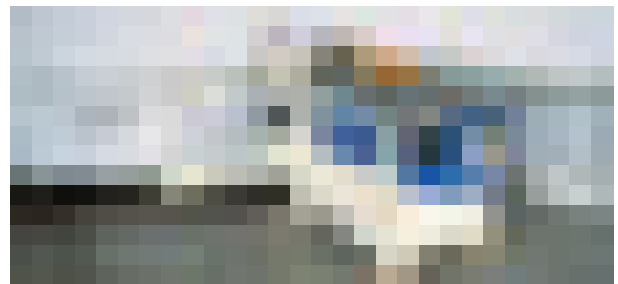
VISTA GENERAL DE LA MÁQUINA FS30 SMART (JPG)