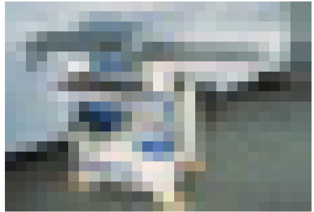
VISTA GENERAL DE LA MÁQUINA ST3 SMART (JPG)