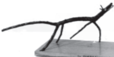
LA ZORRA Y EL CUERVO