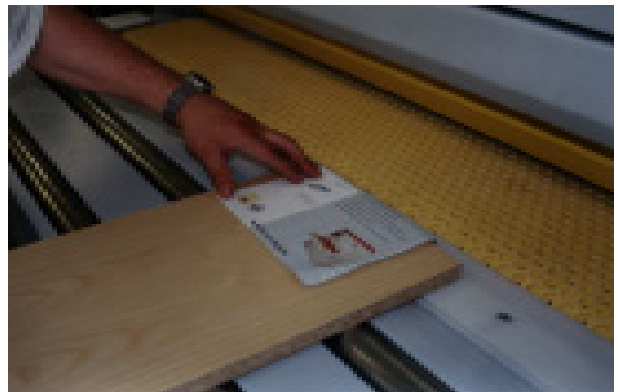
LIJADO DE SÓLO UNAS MICRAS SOBRE LA SUPERFICIE DEL PAPEL: ENTRADA EN LA LIJADORA BÜTFERING

Otras máquinas que formaban parte de la demostración eran una canteadora Brandt, que si bien va destinada al segmento más pequeño de la industria asegura una producción de 12 m/min con todo tipo de cantos; un centro de mecanizado Weeke BHC 550 con 19 portabrocas verticales en ángulo, 2+2 taladros izquierda-derecha, sierra con disco longitudinal y grupo fresador con cambio de herramienta automático y almacén de 8 posiciones. La seccionadora horizontal Sawtech CHF-51 corta tableros en paquetes de hasta 90 mm de altura. Esta máquina fabricada en L'Ametlla del Vallès recibe el nuevo nombre de la filial española del grupo, Homag Sawtech , evidenciando el principal objetivo de la empresa española, no tanto de representar los intereses comerciales y de distribución del grupo para el mercado español, sino de fabricación de una gama específica de seccionadoras para todo el mercado mundial.