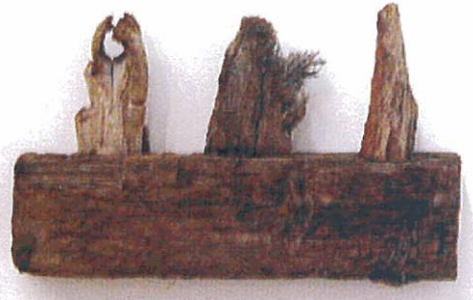
Three scraggs on a shelf