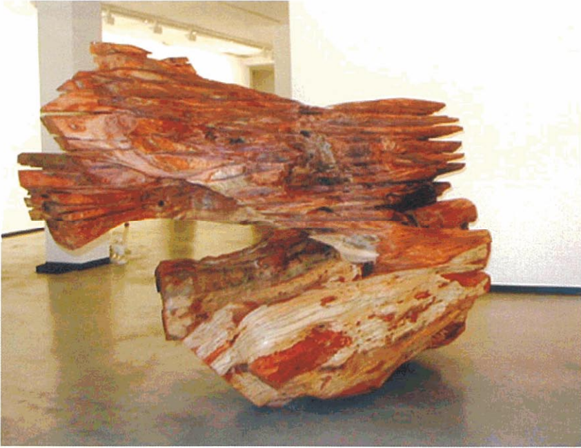
Red Flash 2003