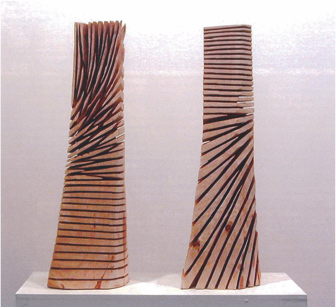
Cut down and across and down