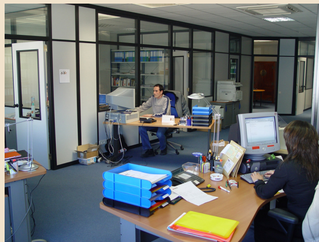
Vista general del área de oficinas de IMA en Alcalá de Henares (Madrid).

IMA ESPAÑA PARQ. EMP. INBISA ALCALÁ I C/ RUMANÍA, s/n. - NAVE D 2 28802 ALCALÁ DE HENARES TEL: 91-8865240 FAX: 91-8857674