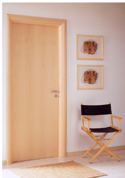
ACEM: puerta de arce

horizontales. Este último modelo se está viendo mucho en nuestro país de pocos años a esta parte, no sabemos inspirado en estas puertas italianas o viceversa (Nusco Porte Spa). Lualdi presenta una puerta plana muy elegante con el chapado horizontal,