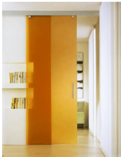
Puertas plegables de Movi y Tre