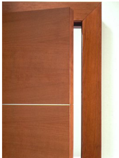
Puerta plana de Lualdi (y detalle)