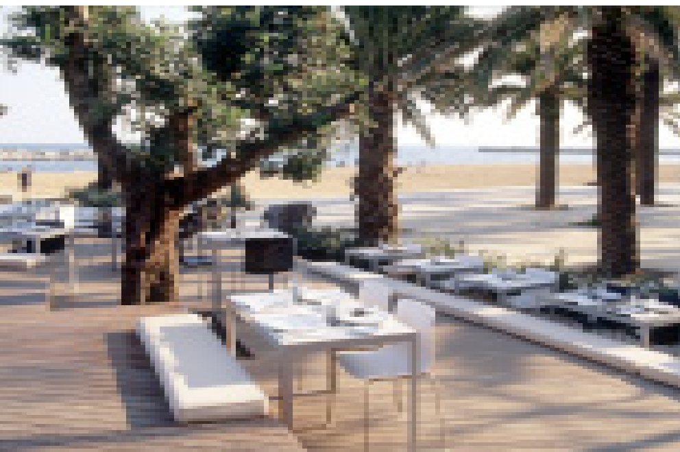
Exterior del restaurante Bestial con pavimento de madera

El restaurante Citrus es un elegante local cuya calidez reside en la madera y en los tonos pastel de sus paredes. Se trata de un restaurante de diseño clásico donde la madera se combina con elementos decorativos en tonos pasteles. El resultado es un local con un aire de jardín interior.