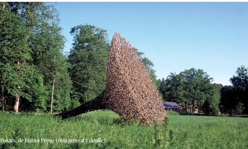
Fiskars, de Jaakko Pernu (vista general y detalle)