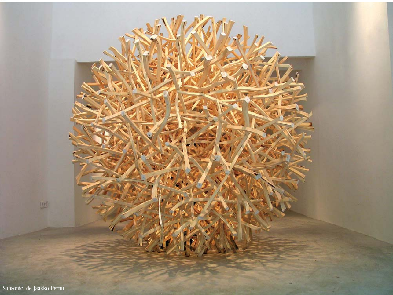
Subsonic, de Jaakko Pernu