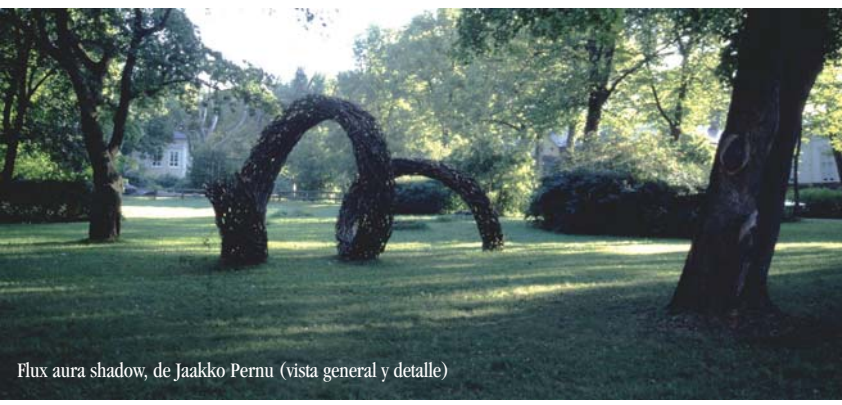
Flux aura shadow, de Jaakko Pernu (vista general y detalle)