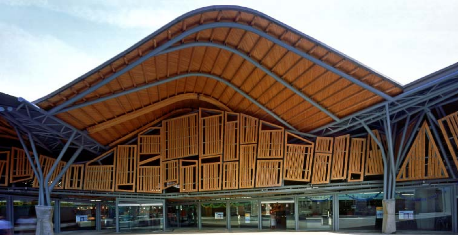
Fachada e interior del Mercado de Santa Caterina, de EMBT Arquitectes Associats