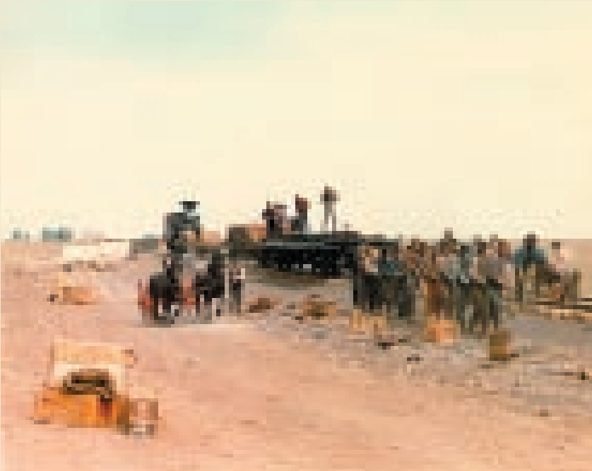
Construcción de la vía de ferrocarril en Canadá 1847-1854

negro, con un alto grado de viscosidad, que hace necesario su calentamiento para poder ser introducido en la madera.