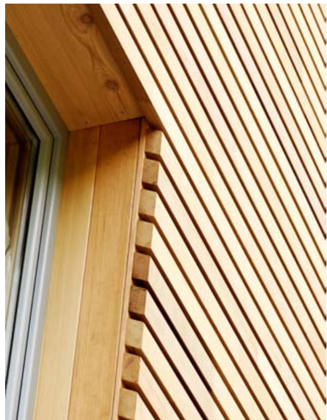
Fachada de lamas de cedro rojo de Canadá con finger joint para celosías o fachadas ventiladas