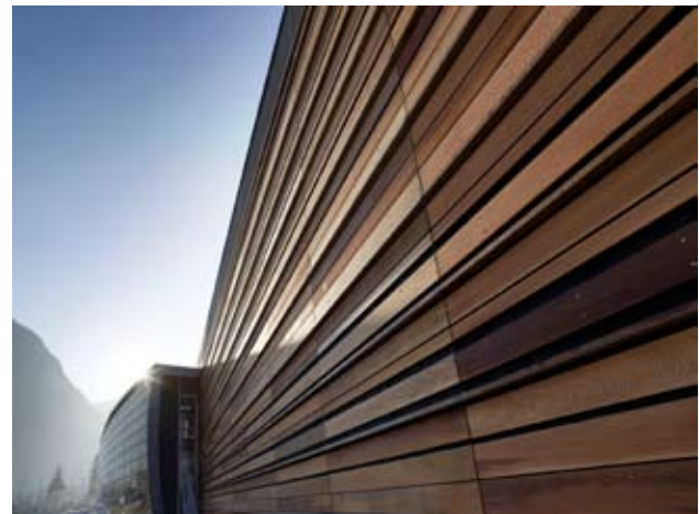
Fachada de la fábrica revestida con distintas especies