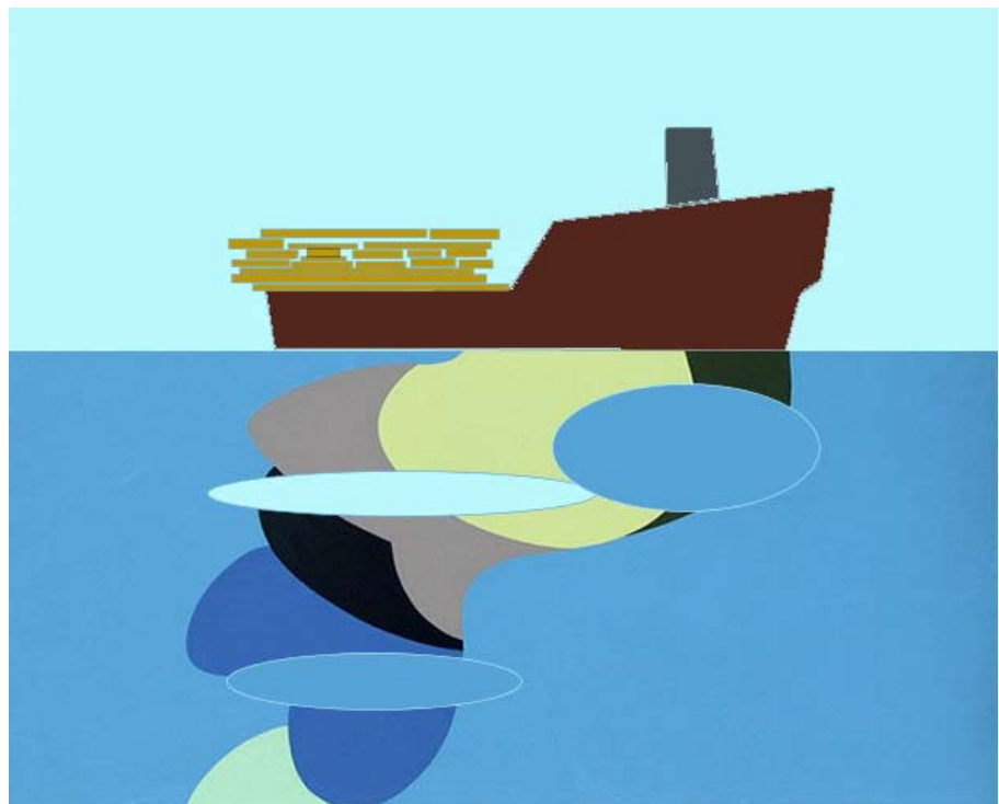
Consumo aparente en millones de €

Por países ganaron los de la antigua zona Oriental y perdieron los de la zona Occidental ▲