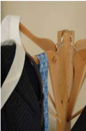
PERCHERO PERCHA 5.5 DESIGNERS WWW.CINQCINQDESIGNERS.COM

En este perchero y en la lámpara 'Mi bello abeto', 5.5 dan una nueva muestra de originalidad, frescura y sencillez. Además lo práctico no queda de lado y el resultado es de una gran utilidad.