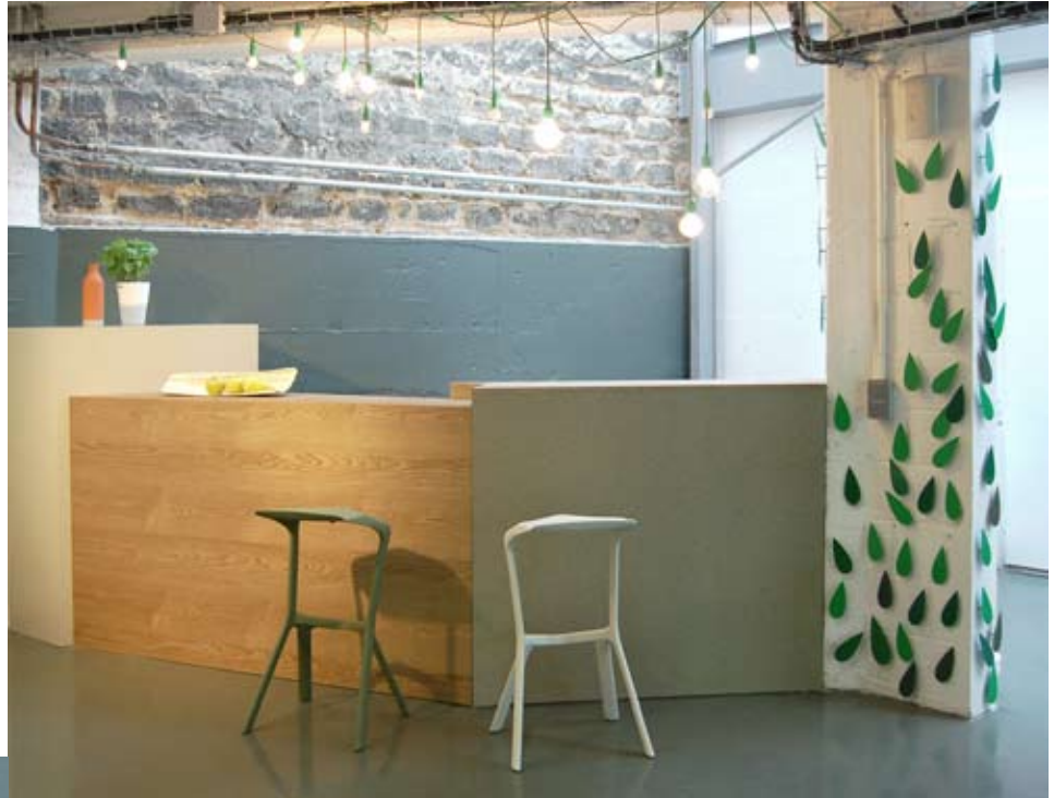
Bar en tablero de partículas rechapado y con protección mejorada a la humedad con su característico color verde

aparecen en la fachada y se continúan dentro formando la iluminación. El mobiliario que ha desarrollado 5.5 es muy sencillo. Juega con diferentes tableros disponibles en el mercado y los usa de forma cruda. Así por ejemplo los tableros aligerados enseñan sus 'tripas', el trillaje de cartón, y el tablero de partículas también muestra su composición interna, lo cual es nada frecuente (no así el OSB que a mucha gente le parece atractivo dejándolo visto).