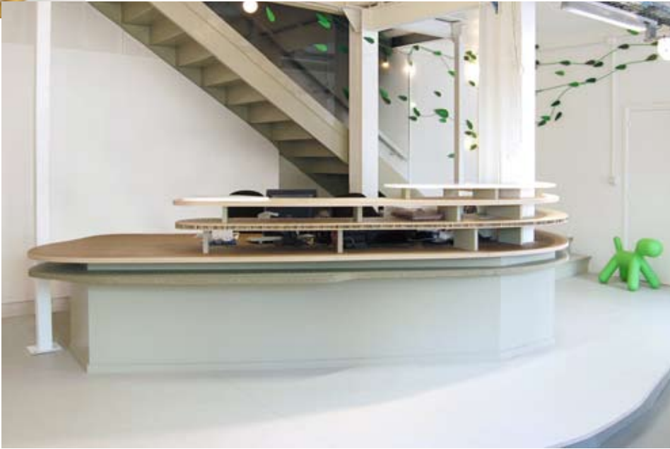
Estantes y mostrador en tablero contrachapado y aligerado