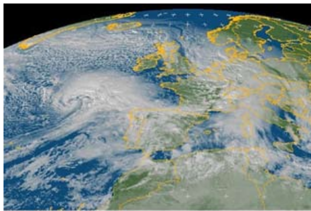
NET9 VIS00G 2009-01-23 14:00 UTC

En dicha reunión se puso de manifiesto esa precaria situación y el grave riesgo que corren las empresas del sector en caso de mantenerse las condiciones actuales. En el caso de las maderas cuyo destino es la desintegración (tablero y papel), parece que un descenso en los precios de tasación podría tener una incidencia muy positiva en la reanudación de las explotaciones regionales de forma que las entradas de madera en rollo se haga en condiciones que permitan mantener la competitividad de las empresas de transformación de la Comunidad y el retorno de una parte de las de aprovechamientos. Este fue uno de los argumentos expuestos para solicitar de la Administración que las tasaciones en las subastas de otoño de próxima celebración se ajusten a los precios de mercado actualmente existentes. Se expuso además la preocupación existente en el sector ante la posible desaparición en el futuro de las subastas de este tipo de maderas que hasta ahora realizaba mayoritariamente la Administración regional