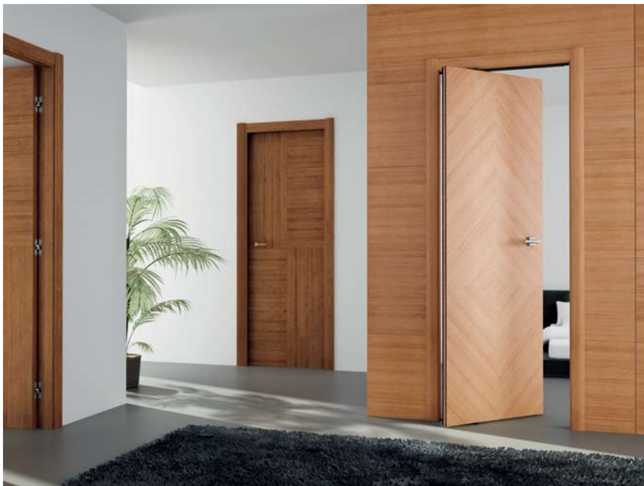
En primer plano, puerta pivotante con chapado en nogal en dibujo de diamante. En segundo plano puerta abatible con chapado en gran damero. Los apajuntas verticales en perfil abombado y el horizontal, plano