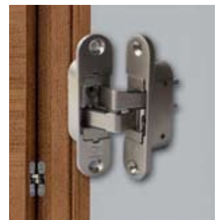
Bisagra oculta. Todas las puertas de la colección VITA vienen equipadas con bisagras ocultas (de librillo).