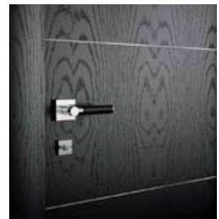
Manilla de cuero