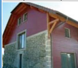
VIBRATO, Douglas CL3 cepillado