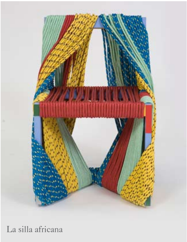
La silla africana