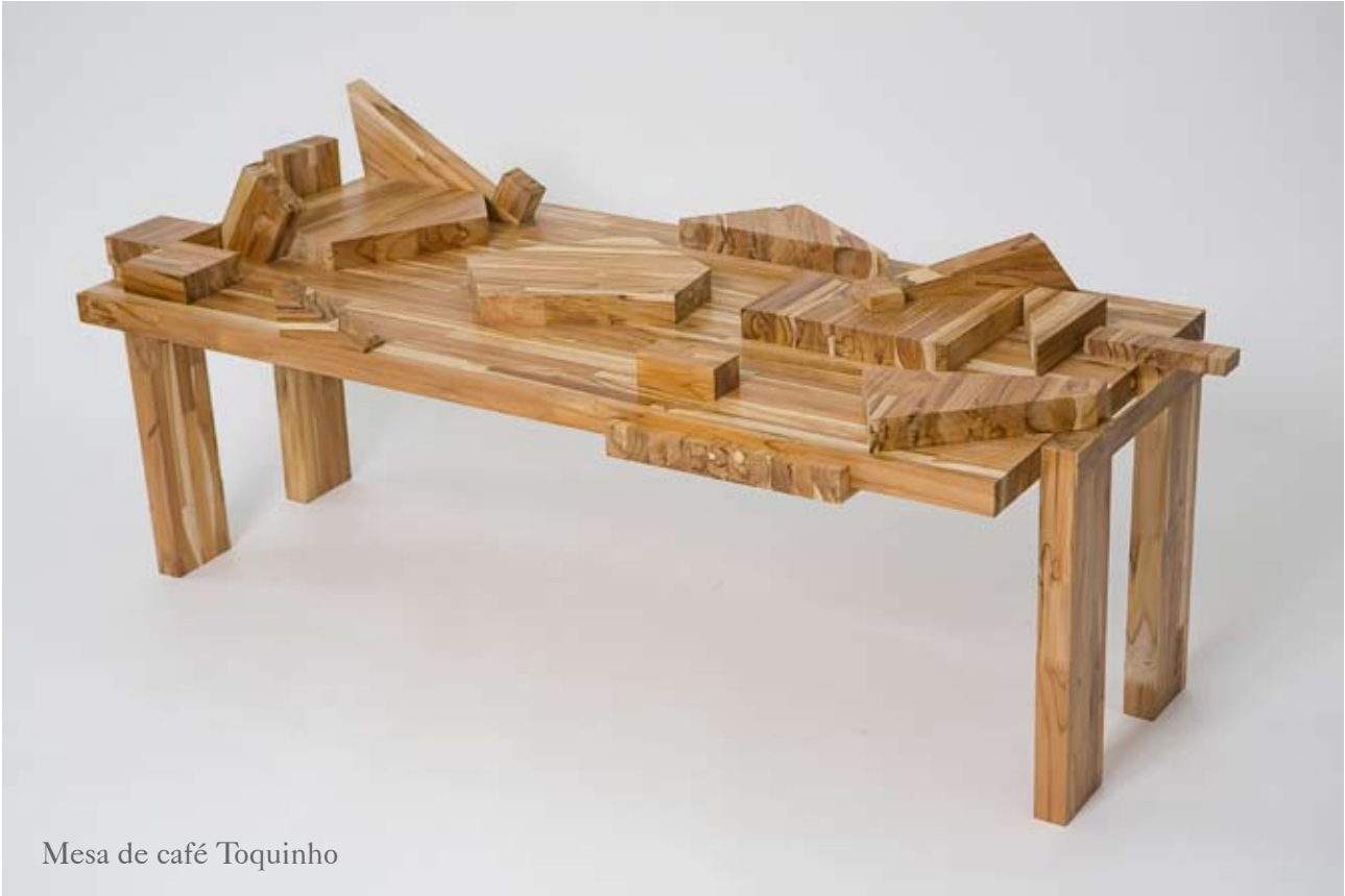
Mesa de café Toquinho