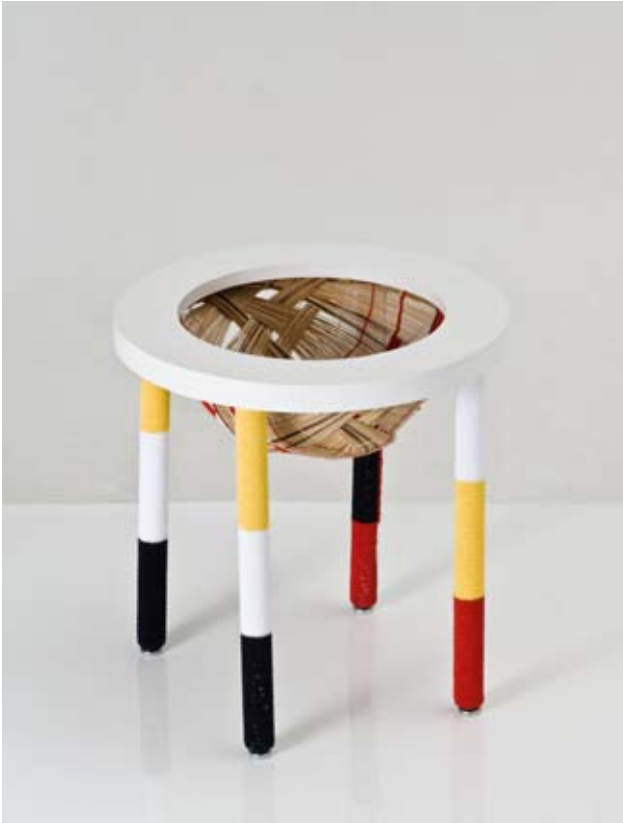
Oca Oca significa Casa indígena y es el nombre de un famoso proyecto de Oscar Nienmeyer en Sao Paolo.