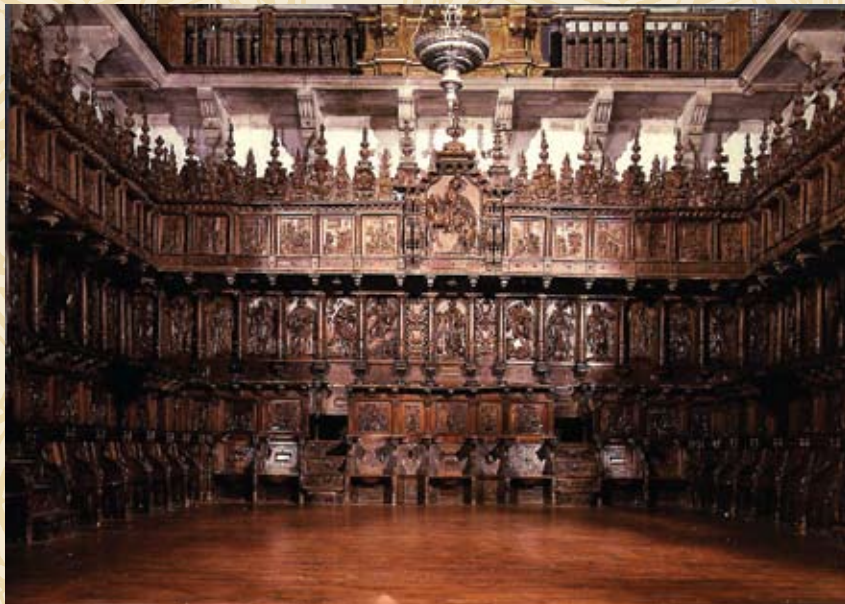
Sillería del coro de la iglesia de San Martín de Pinario (Santiago de Compostela)

Restauración especializada de la madera mediante el sistema BETA, a base de resinas epoxídicas especiales y varilla de fibra de vidrio pretensada