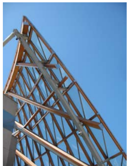
Interior de la Galería Italia, llamada así por las contribuciones económicas de la comunidad italiana de Toronto y por dedicarse a artistas italianos. La estructura es de MLE de abeto Douglas