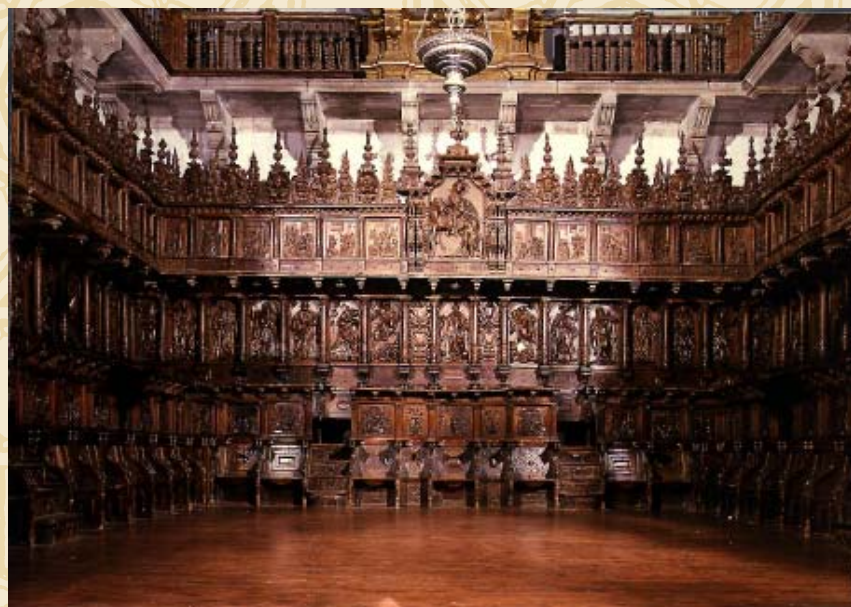
Sillería del coro de la iglesia de San Martín de Pinario (Santiago de Compostela)

Restauración especializada de la madera mediante el sistema BETA, a base de resinas epoxídicas especiales y varilla de fibra de vidrio pretensada