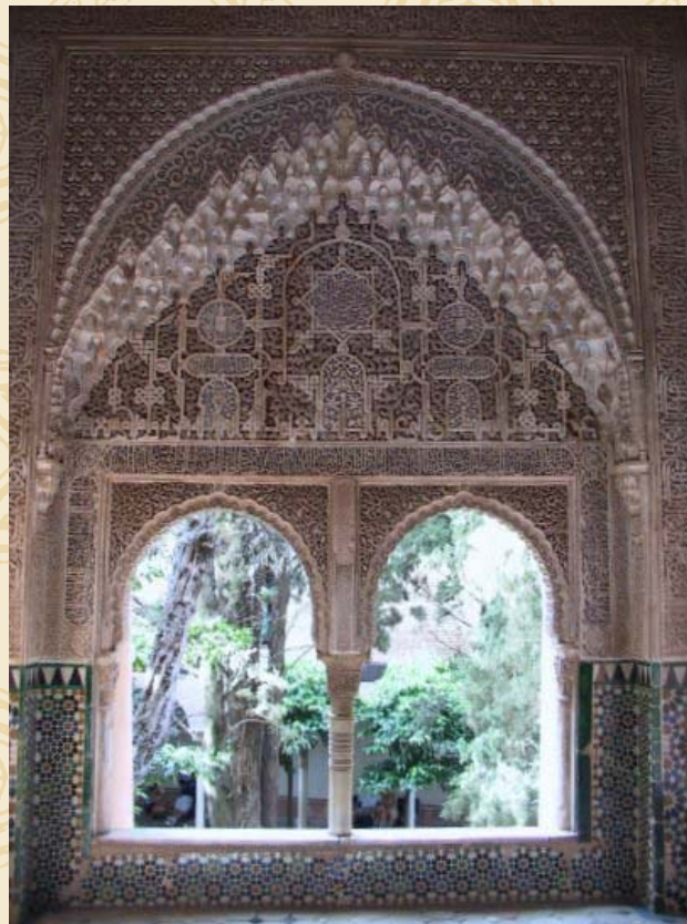
Mirador de Lindaraja. Alhambra de Granada

Tratamientos curativos y preventivos contra insectos y hongos xilófagos en madera estructural