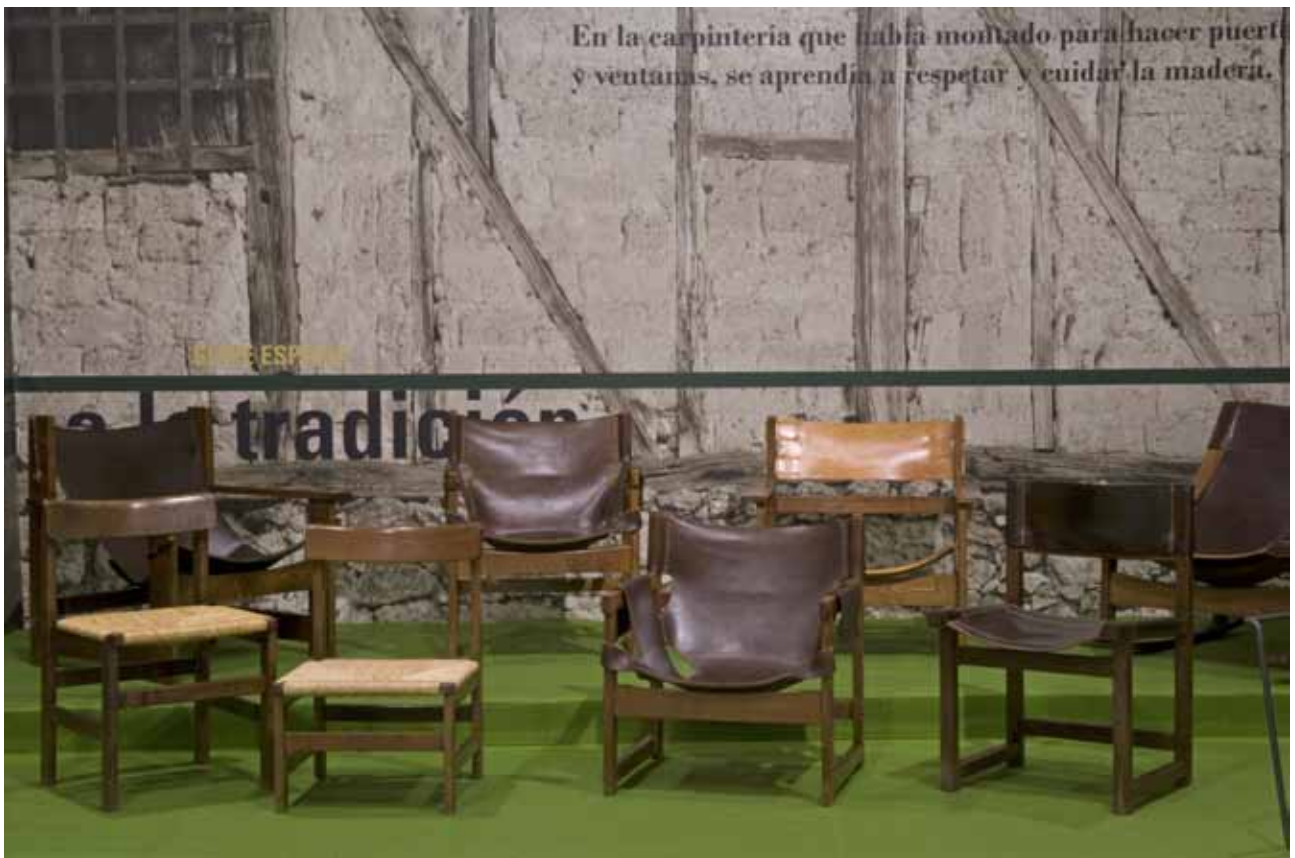
Exposición realizada en el Museo Nacional de Artes Decorativas (Madrid) en 2008