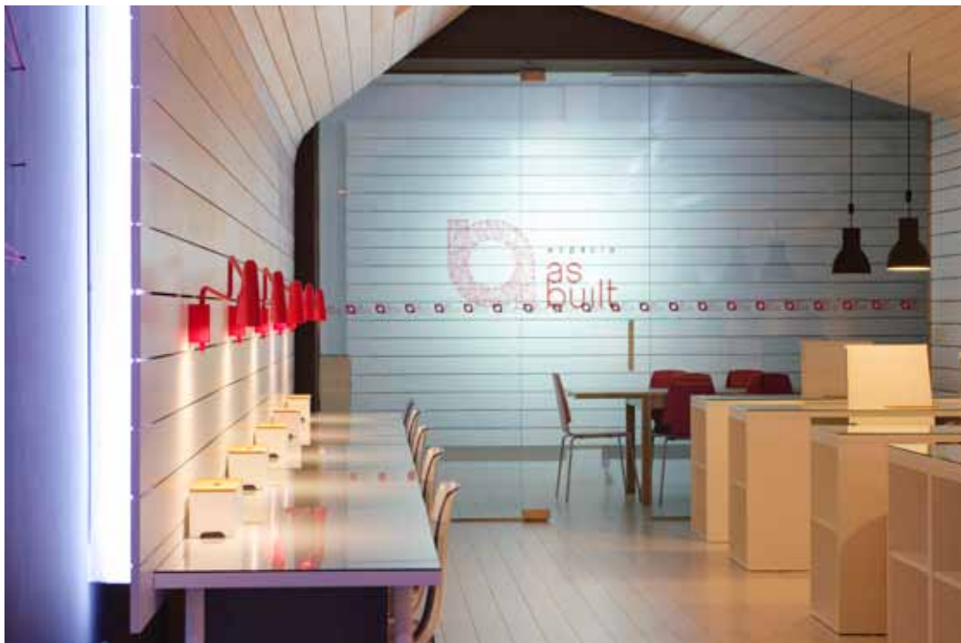
Vista general de la zona de co-working