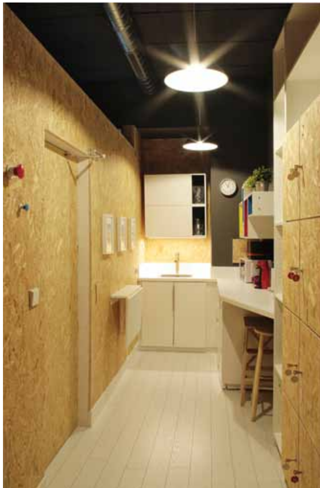
Office, fuera ya de la envolvente de la cabaña revestido con tablero de virutas OSB de 16 mm