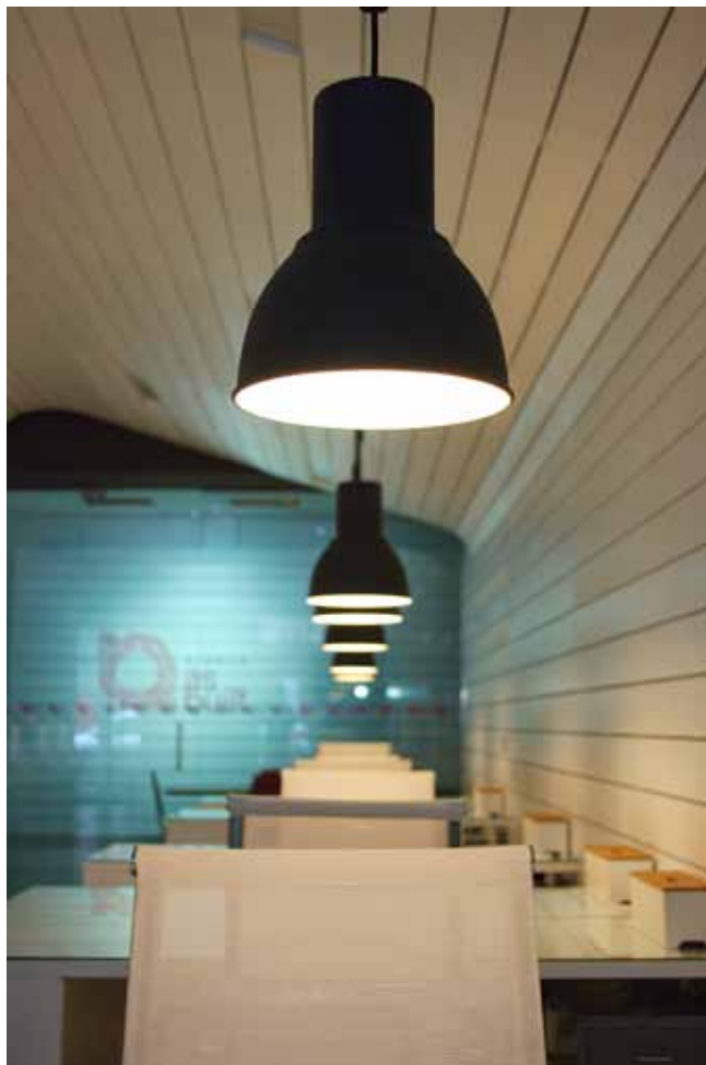
Detalle de iluminación de la zona de co-working