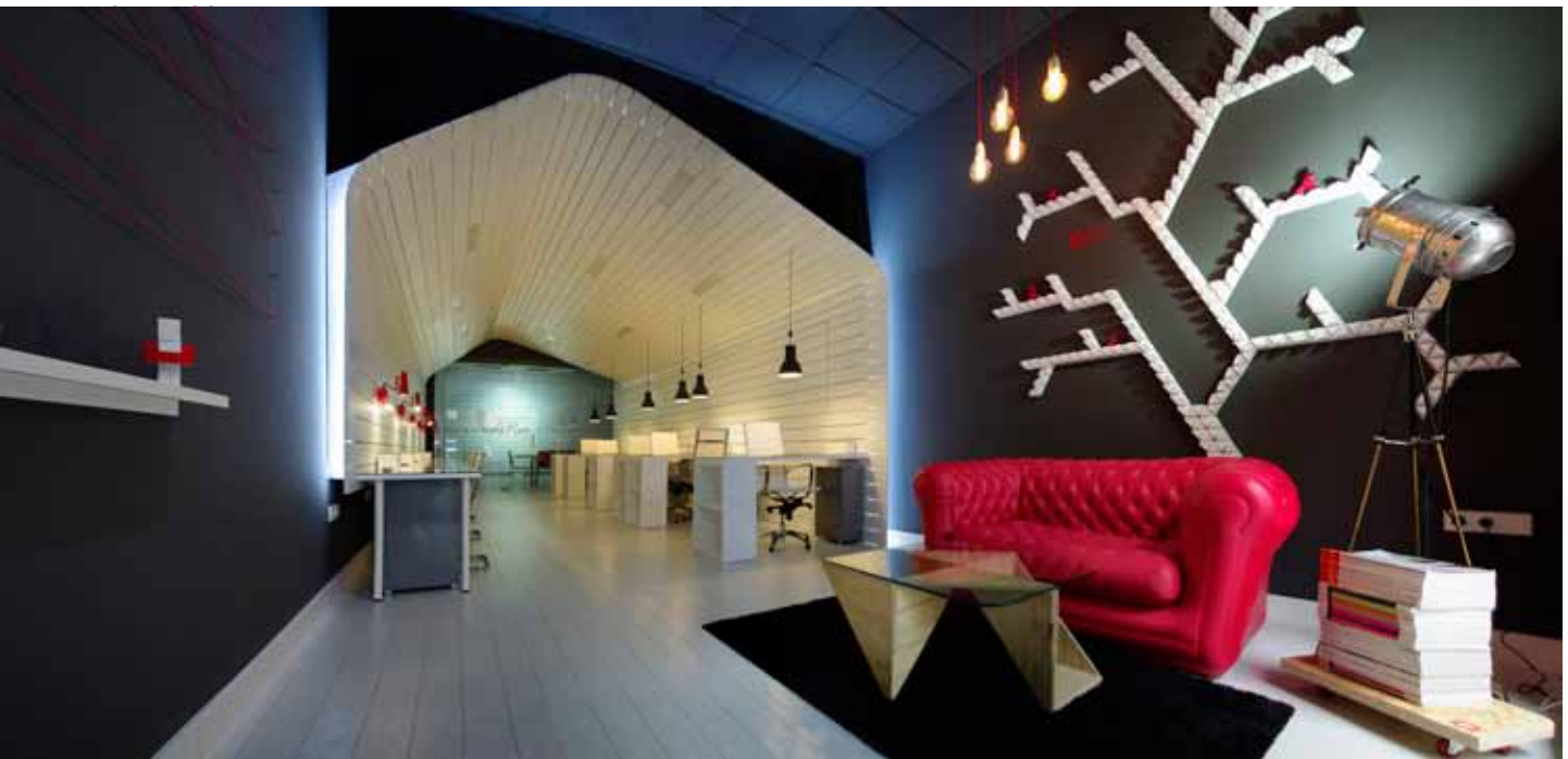
Instalación en forma de árbol, realizada mediante vasos geométricos de plástico blanco