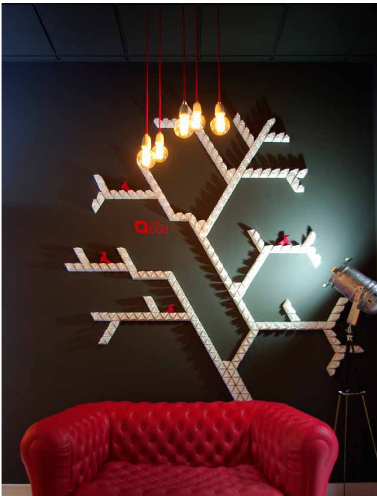
Vestíbulo con la "instalación" en forma de árbol