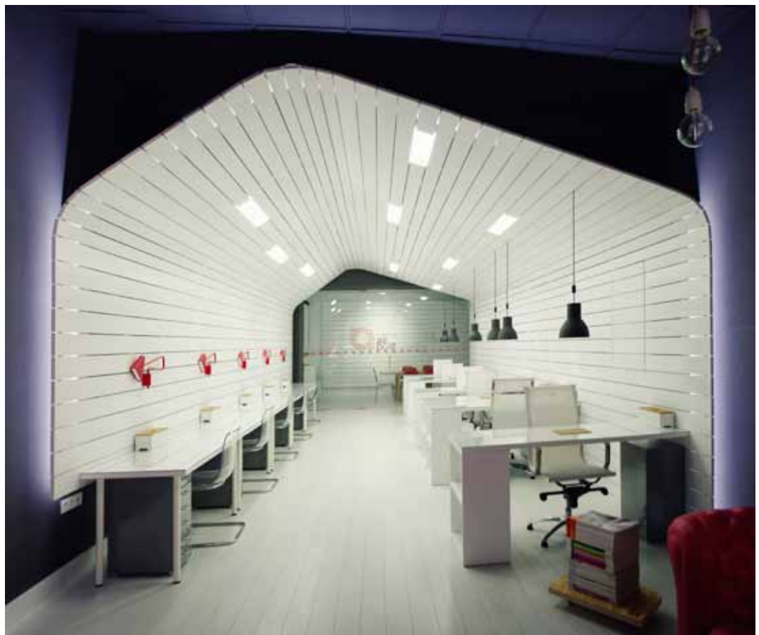
Quilla de barco invertida con tablas de tableros de densidad media FINSA lacados en blanco